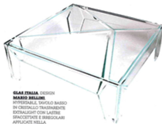
GLAS ITALIA , DESIGN MARIO BELLINI . HYPERTABLE, TAVOLO BASSO IN CRISTALLO TRASPARENTE EXTRALIGHT CON LASTRE SFACETTATE E IRREGOLARI APPLICATE NELLA SUPERFICIE INFERIORE. LOW TABLE IN EXTRA-LIGHT TRANSPARENT GLASS WITH FACETED AND IRREGULAR PANES APPLIED ON THE LOWER SURFACE. glasitalia.com