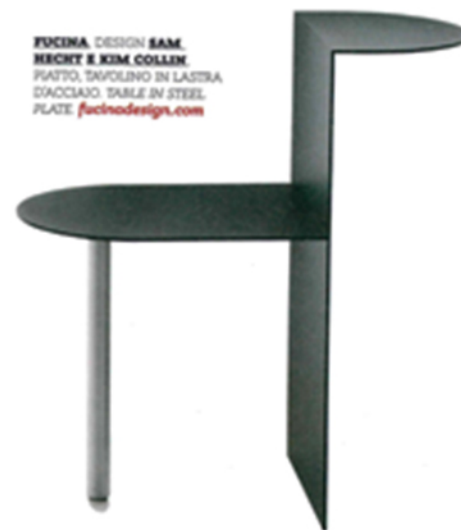
FUCINA , DESIGN SAM HECHT E KIM COLLEN . PIATTO, TAVOLINO IN LASTRA DIACCIAIO. TABLE IN STEEL PLATE. fucina.com