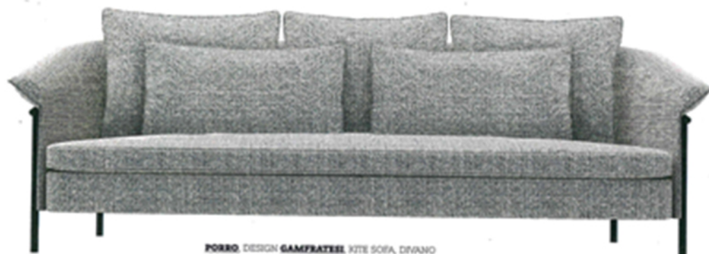
PORRO , DESIGN GAMFRATTI . KITE SOFA, DIVANO CON STRUTTURA IN TONDO DIACCIAIO VERNICIATO NERO. RIVESTIMENTO IN TESSUTO. SOFA WITH STEEL ROD STRUCTURE, PAINTED BLACK, COVERED IN FABRIC. porro.com