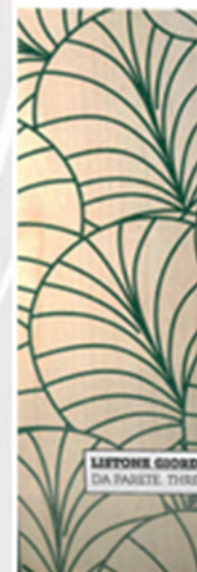
LIFTORE GIORDANO , DESIGN ALDO CERRE . LINEADICO, SUPERFICIE TRIDIMENSIONALE DA PARETE. THREE-DIMENSIONAL WALL SURFACE. liftonegiordano.com